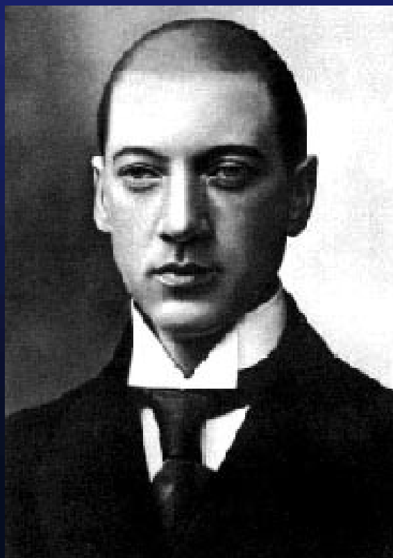
Гумилев Николай Степанович 1886-1921 гг.