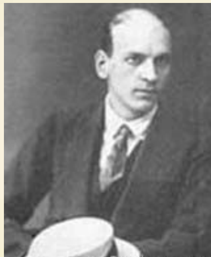
Нарбут Владимир Иванович 1888-1938 гг.