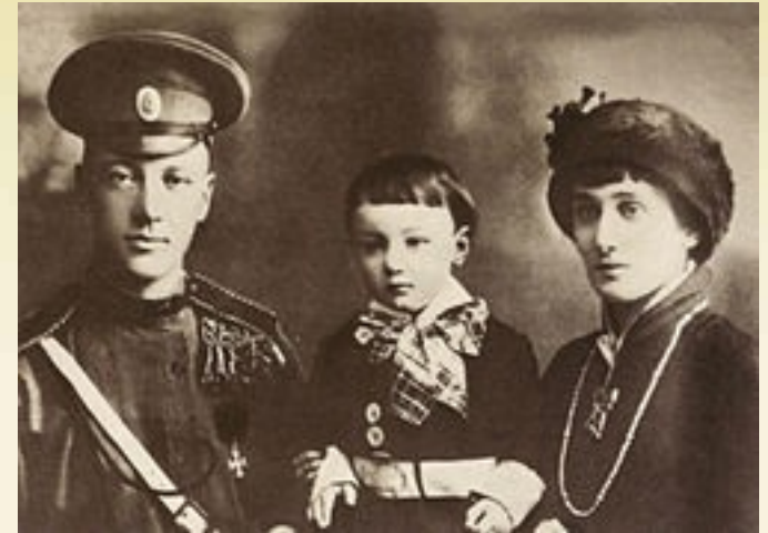
Анна Ахматова с мужем Н. С. Гумилевым и сыном Львом