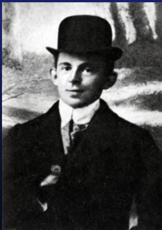
Мандельштам Осип Эмильевич 1891—1938 гг.