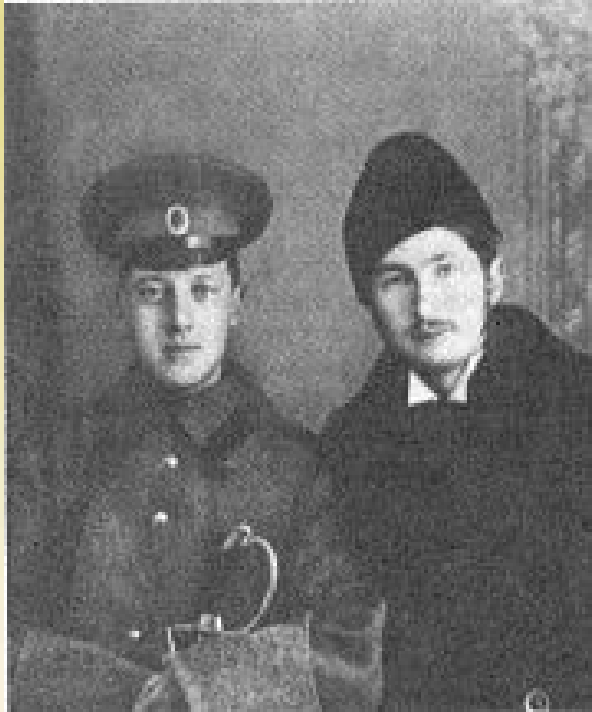
Н. Гумилев и С. Городецкий, 1910 г.

Посох мой цветущий, Друг печальных дней, Вдаль на свет ведущий Вечных звезд верней!