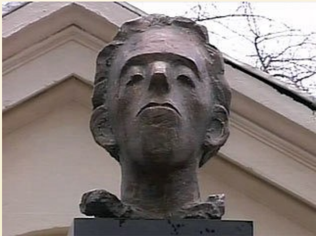
Памятник Осипу Мандельштаму в Москве

Первая книга молодого поэта "Камень" (1913 г.; второе издание – 1916 г.), вышедшая под маркой издательства "Акмэ", представила читателю Мандельштама-акмеиста.