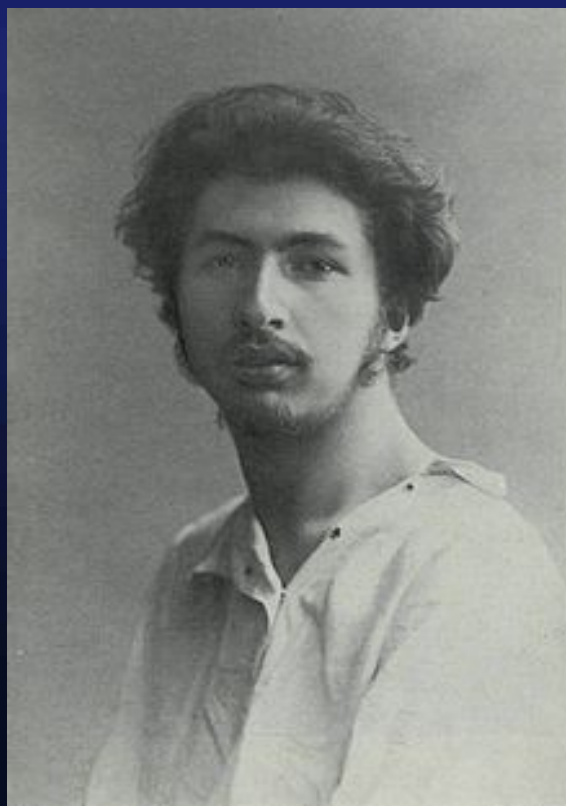
Городецкий Сергей Митрофанович 1884-1967 гг.