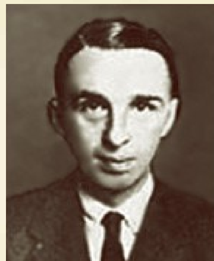
Иванов Георгий Владимирович 1894-1958 гг.