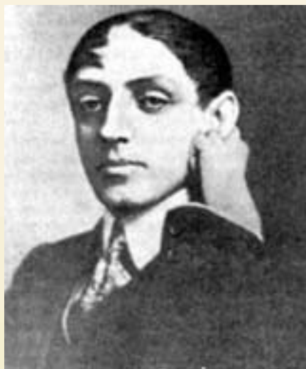
Кузмин Михаил Алексеевич 1872-1936 гг.

Поэтому можно отвести акмеизму почетное место в истории русской литературы начала XX века.